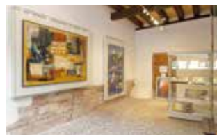
Museum Théo Kerg